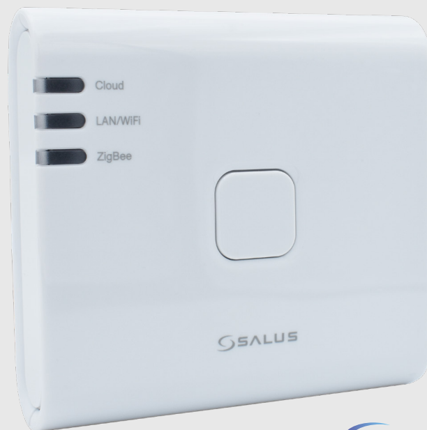
SALUS išmaniųjų namų asortimento pagrindas

SALUS UG800 išmaniųjų namų vartai yra centrinis SALUS išmaniųjų namų sistemos mazgas, leidžiantis iki 100 išmaniųjų įrenginių sklandžiai bendrauti ir sąveikauti tarpusavyje. Šie vartai sukuria vieningą, išmaniąją ekosistemą, kurioje tokie prietaisai kaip termostatai, išmanieji kištukai ir relės bendradarbiauja, kad optimizuotų komfortą, energijos vartojimo efektyvumą ir patogumą. UG800 leidžia lengvai nustatyti ir valdyti išmaniųjų namų tinklą, užtikrinant, kad visi prijungti prietaisai veiktų darniai. Nesvarbu, ar valdote savo šildymo, apšvietimo, ar apsaugos sistemas, šliuzas suteikia reikiamą infrastruktūrą, kad viskas veiktų sklandžiai. SALUS UG800 sukurtas atsižvelgiant į naudotojų patogumą, jis yra kompaktiškas ir nepastebimas, todėl lengvai įsiliesia į bet kokią namų aplinką, neatkreipdamas į save dėmesio. Nepaisant nedidelio dydžio, jis pasižymi įspūdingomis galimybėmis, įskaitant iki 100 Mbps Ethernet ryšio greitį, užtikrinantį stabilų ir patikimą interneto ryšį jūsų išmaniųjų namų įrenginiams. Šis didelės spartos ryšys padeda palaikyti ryšį tarp prietaisų realiuoju laiku, todėl galima akimirksniu reaguoti ir valdyti naudojant „SALUS Smart Home“ programėlę.